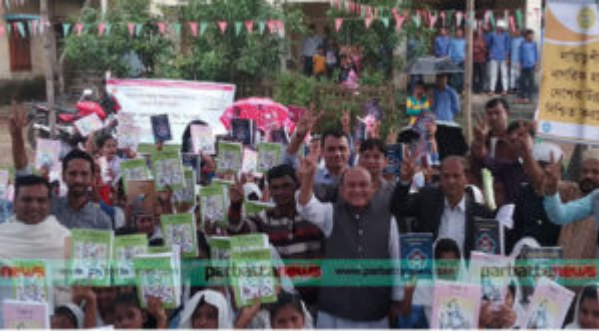
কক্সবাজারে সনদের বিহীন শিক্ষা প্রতিষ্ঠানে নই বিতরণ উপরে সাহসন কর্মসে সাবে উজ্জ্বলিত শিক্ষার্থীরা