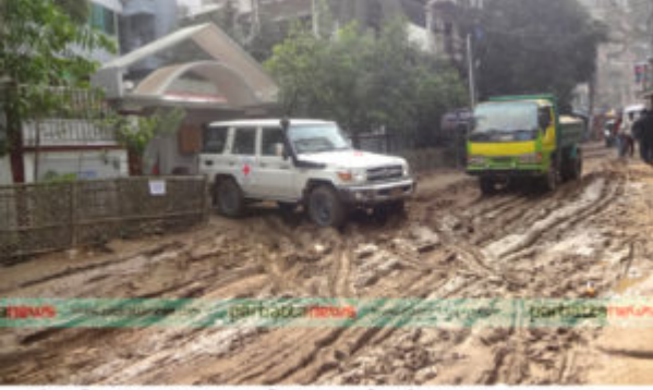
পাটনি শাখার হেল্প-হেল্প সার্ভিসে জলপটী সড়ক সংযোগ পুঁজিতে কীভাবে কাজে লাগে। যখন যানবাহন ও পিকআপের চাপেই সড়ক দুর্ভাগ্য বিড়াল করতে। ছবিটি গারভাস দুব্বার দুপুরে তোলা।