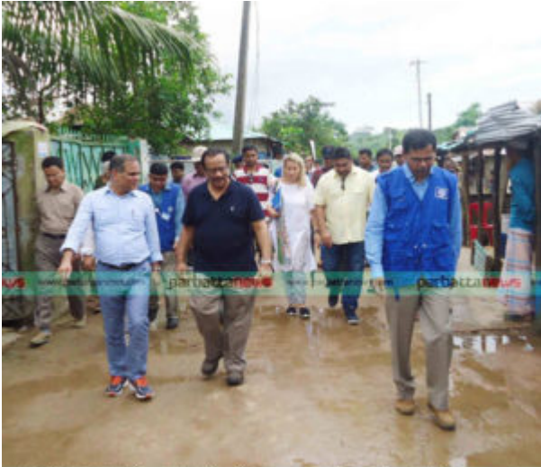
অনিবদ্ধিত শরণার্থী ক্যাম্প পরিদর্শন করছেন ন্যাশনাল টাস্কপোর্সের সদস্যরা।