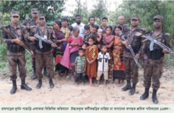
(সশস্ত্র স্বেচ্ছাসেবকরা গণসংহতি বাংলাদেশের সশস্ত্র স্বেচ্ছাসেবকদের সাথে একটি পরিচয় সাক্ষাৎকালে ১৯৯৯)।

গণসংহতি বাংলাদেশ : এই সংগঠনের মূল উদ্দেশ্য হল বাংলাদেশের স্বাধীনতা, সার্বভৌমত্ব এবং জনগণের মৌলিক অধিকার রক্ষা করা। সংগঠনটি দেশের উন্নয়ন, শান্তি স্থাপন এবং গণস্বতন্ত্র প্রতিষ্ঠার জন্য কাজ করে।