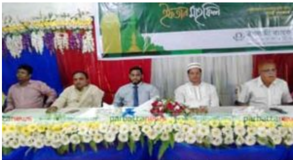
কেটি বাজার ইসলামী ব্যাংকের ইফতার মাহফিলে উপজেলা নির্বাহী অফিসার সহ অন্যান্য অতিথিরা

কোম্পানী পরিচালনা পর্ষদের সভা অনুষ্ঠিত হইল। সভাপতি কর্তৃক সভার কার্যক্রম পরিচালিত হইল। সভায় কোম্পানীর কার্যক্রম, আর্থিক অবস্থা, বিনিয়োগ পরিকল্পনা, মূল্যায়ন, ঝুঁকি পরিচালনা, পরিবেশ সুরক্ষা, কর্মচারী কল্যাণ, গভর্নেন্স ইত্যাদি বিষয়ে আলোচনা হইল। সভায় সিদ্ধান্ত গৃহীত হইল।