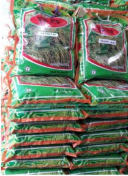
কৃষকদের চাহিদা পূরণে স্থানীয় ভাবে উৎপাদিত উন্নত জাতের মৃতা বীজ